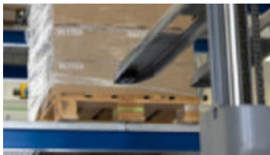
Lasermodule gemonteerd in de vork...